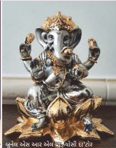
બુનેલ એસ આર એલ પ્રોડ્યુક્સ ઇન્ટર