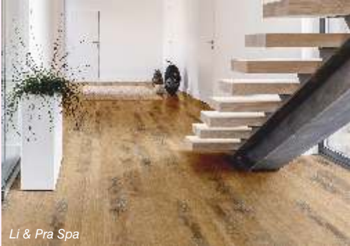
Li & Pra Spa

એચજીએચ ઇન્ડિયામાં તમને ગ્રીનલામ (ઇન્ડિયા) અને લિએન્ડપ્રા એસ પી એ (ઇટાલી)માંથી વૂડન અને લેમિનેટેડ ફ્લોરિંગ જોવા મળી શકે છે, એટીએમ એન્ટરપ્રાઇઝીસ વિવિધ આયાતી વૂડન અને લેમિનેટેડ તથા તેની પોતાની બ્રાન્ડ નેમ, ડિઝાઇનર્સ ફ્લોરિંગ અંતર્ગત ફ્લોરિંગ્સ દર્શાવશે. મેટ્રસ ફોર એન્ડ કોઇર ક્રાફ્ટ કોઇરમાંથી બનેલી ડોર મેટ્રસ દર્શાવશે.