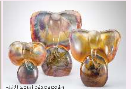
ઝેનેટ્ટી મુરાનો એસઆરએલ