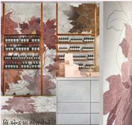
લિ એન્ડ પ્રા એસપીએ