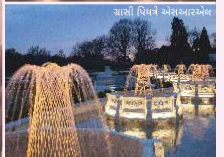
ગ્રાસી પિયને એસઆરએલ