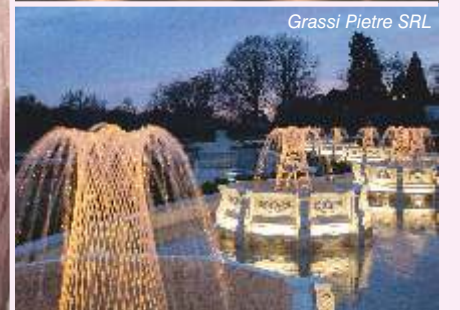
Grassi Pietre SRL