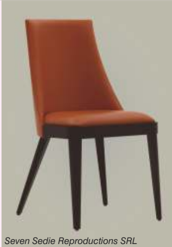
Seven Sedie Reproductions SRL