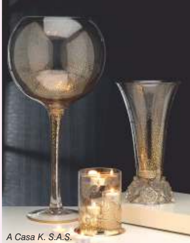
A Casa K. S.A.S.

इटालियन नॅशनल पॅव्हेलियनमध्ये सहभागी असलेल्या इटालियन कंपन्या (खाली केलेल्या कंपन्यांच्या उत्पादनांचा उल्लेख करून त्यांची चिन्हे ठेवा)-