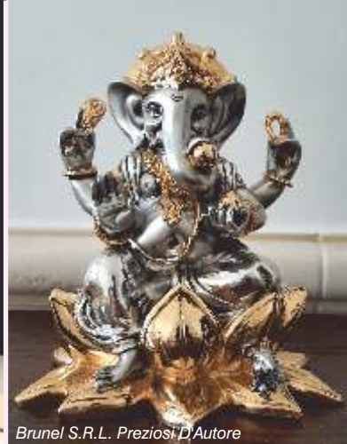
Brunel S.R.L. Preziosi D'Autore