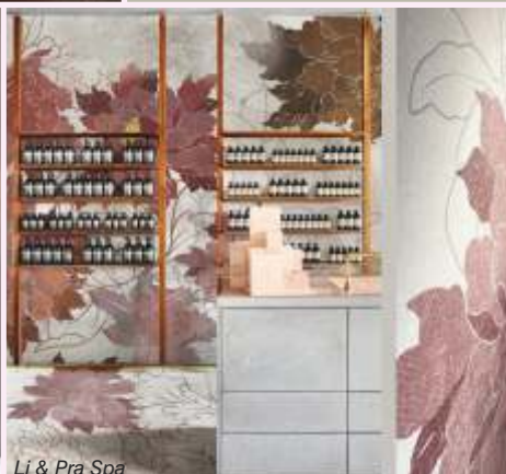
Li & Pra Spa