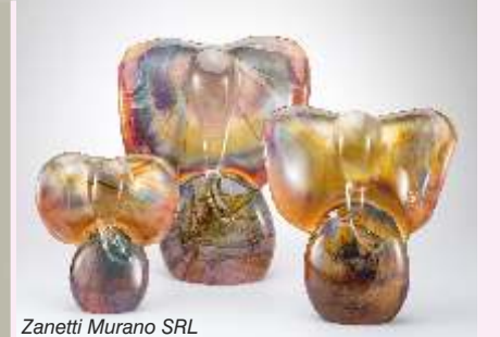
Zanetti Murano SRL